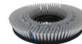
Schrubbbürste Waschbeton Art.-Nr. TBU07045