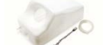
Laugentank 10 l Art.-Nr. 891320.000102