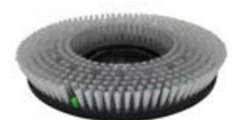
Schrubbbürste, mittel Art.-Nr. TBU07046