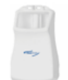
Laugentank 13 l Art.-Nr. 891321.000102