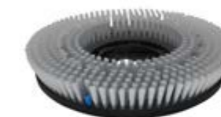
Schrubbbürste Waschbeton Art.-Nr. TBU07045