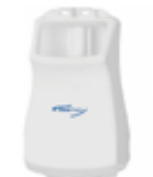
Laugentank 13 l Art.-Nr. 891321.000102