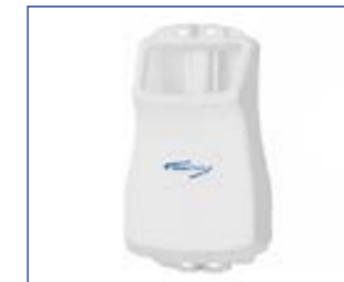
13 L. Laugentank