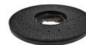
Treibteller Art.-Nr. TBU07047