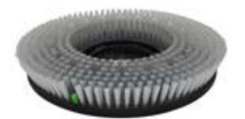
Schrubbbürste, mittel Art.-Nr. TBU07046