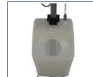
10 L Laugentank