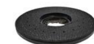
Treibteller Art.-Nr. TBU07047