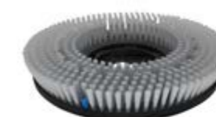
Schrubbbürste Waschbeton Art.-Nr. TBU07045