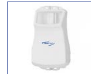
13 l Laugentank