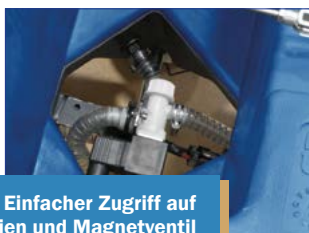
Einfacher Zugriff auf Batterien und Magnetventil