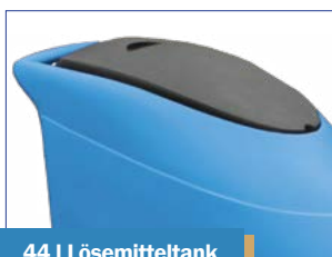
44 l Lösemitteltank 60 l Abwassertank