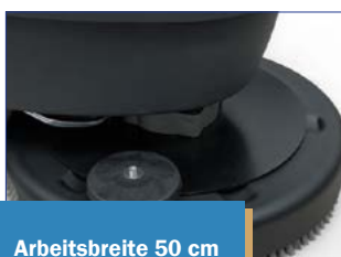
Arbeitsbreite 50 cm