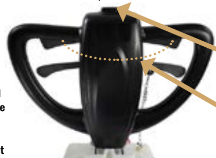
CleanTrack Q! Basic