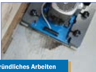
Gründliches Arbeiten an Kanten