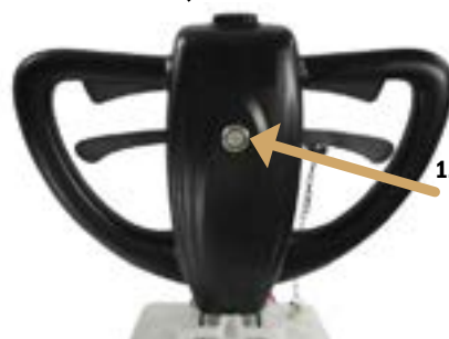
CleanTrack Q! Premium